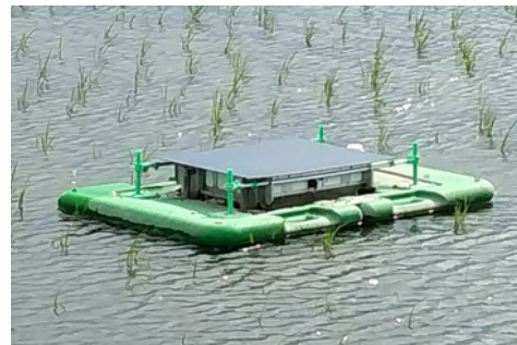
アイガモロボに搭載される インリー社製太陽光パネル