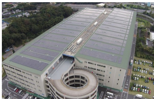
インリー社のパネル導入事例