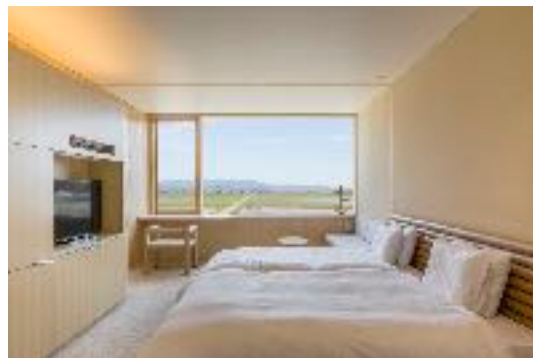
スーペリアツイン(29㎡)

華美ではない、シンプルな美しさを追求した、木造ならではの温もりのあるお部屋です。「GASSAN」「HAGURO」「YUDONO」出羽三山の名称を冠する3つの棟には143部屋が配置され、寛ぎの広さを約束するダブル、ツイン、スイートタイプのお部屋と、団体で利用できるグルーブルームの計4種類をご用意しています。窓からは庄内平野の原風景や中庭など、趣ある景色を臨むことができます。