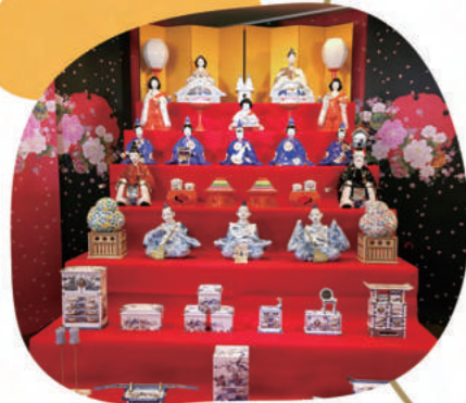
世界最大の磁器製座りひな七段飾り【高さ:2m70cm】 おひなさま【高さ:43cm】〈しん原作〉