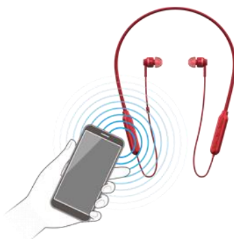
【NFC 機能搭載の Bluetooth®対応機器と簡単接続】

NFC 機能を搭載した Bluetooth®対応のスマートフォンや携帯電話、DAP などを本機にかざすだけで簡単に接続ができるので、保存した楽曲などをワイヤレス再生で手軽に楽しむことができます。