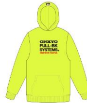
画像はイメージです。

発売日前に事前ご予約されたお客様の中から抽選で、FULL-BK & ONKYO コラボオリジナルフーディーをプレゼントいたします。