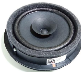
MOIが生産販売を行う 車載スピーカユニット

今秋には、自動車販売においてインド最大規模の日系メーカー向けスピーカユニットが数量ベースでコロナ前比150%を超える受注を頂いていることが功を奏しており、10月時点では新型コロナウイルスによるロックダウン前と比較し金額ベースで135%の生産販売を達成しました（下図参照）。