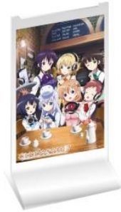
《ヘッドホンスタンド》