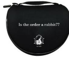
《キャリングケース》