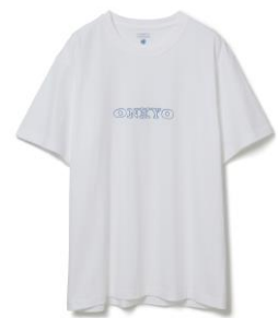
④Tシャツ オンキヨーロゴ