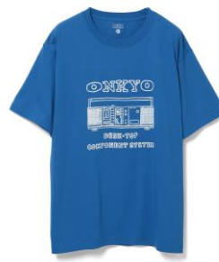
③Tシャツ デスクトップコンポーネントシステム