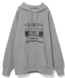
①フード付きパーカー デスクトップコンポーネントシステム

当社としては初となる企業ロゴ「ONKYO」をモディファイしたグラフィックと、1981年発売のデスクトップコンポ ZAC55 をイラスト化した2つのプリントが、Tシャツとフーディーに落とし込まれました。