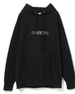
②フード付きパーカー オンキヨーロゴ