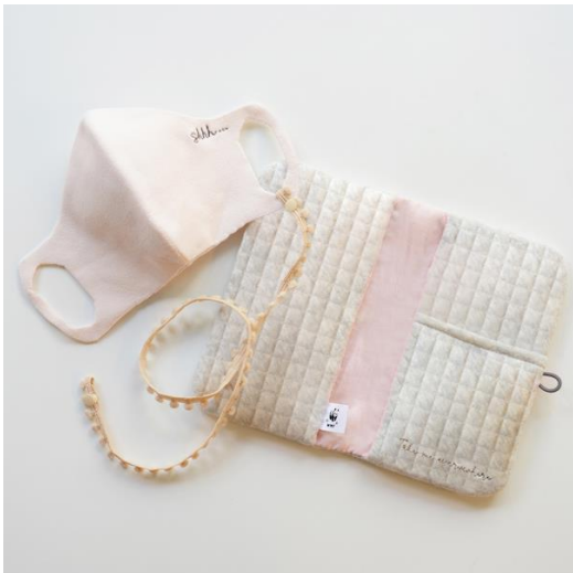
亘 つぐみさんデザイン