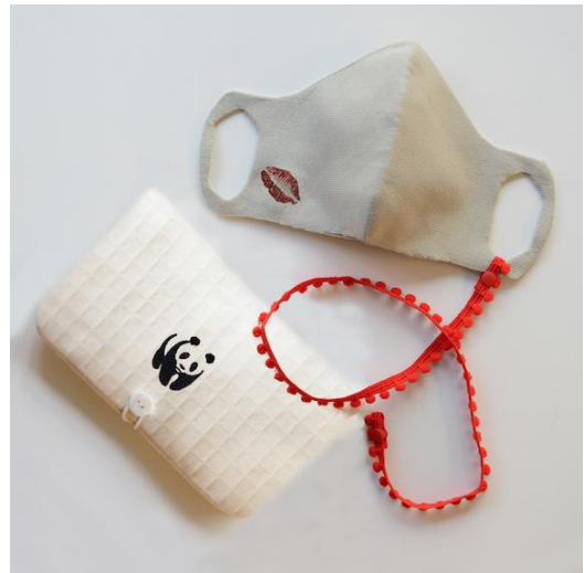
百々 千晴さんデザイン

ウォッシュブルな抗菌マスクとマスクケース、ストラップのセット。 マスク下部にあるポケットよりフィルターやキッチンペーパーなどを挿入でき、シーズンや環境に合わせて機能強化が可能です。 マスクケースにパンダロゴのタグが付きます。