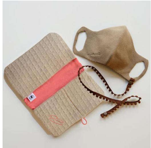
白濱 イズミさんデザイン