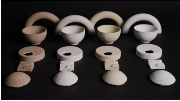
▲DUST TO DUST

10月28日(木)より開催するバーチャル展示会「Toyoshima Virtual Pavilion」では、この11の研究プロジェクトのビジョンやコンセプトをまとめたショーケースをご覧くださいことができます。