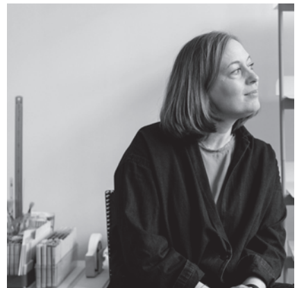
セシリエ・マンツ