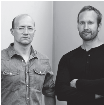
アンデシェン & ヴォル