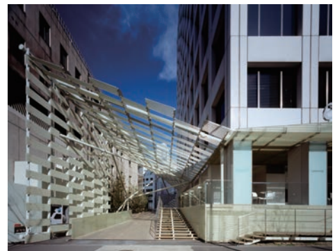
NTT 青山ビル 1F（エスコルテ青山）