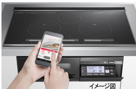
プレミアムブラック(K) HT-L350KTWF

専用アプリで、レシピの検索や調理の設定などがラクにできる コネクテッド家電として、 IH クッキングヒーター「火加減マイスター」を発売