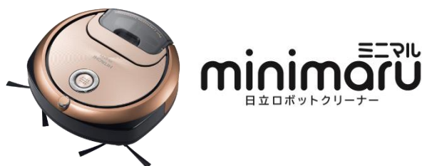
ディープシャンパン(N) RV-EX20

「曜日ごとに決めた時間で掃除ができる」「急な来客でも外出先から掃除ができる」など、スマートフォンでつなげることで、さらに便利に使えるロボットクリーナー「 ミニマル minimaru」RV-EX20を2月下旬から発売します。スマートフォン専用アプリ (*) で、外出先からスケジュール予約や掃除スタート、ストップ、掃除履歴やWeb取扱説明の閲覧もでき、ロボットクリーナーによる新たな生活を提案していきます。