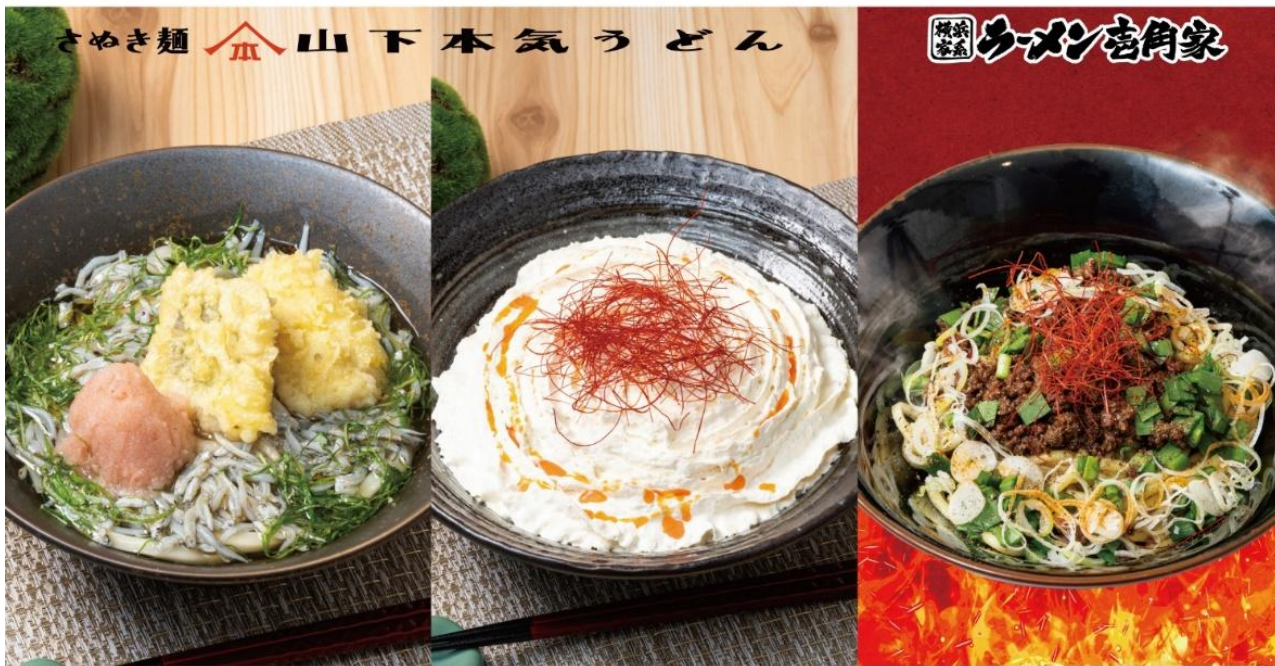
しらすとハモ天の梅おろし冷かけうどん