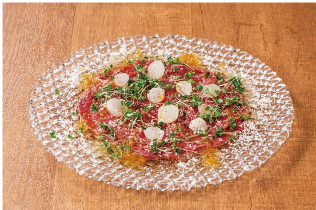
※(左上)極上月見寿司 (右上)フレッシュフルーツサワー (左下)なだれる NIKURA (右下)馬肉ロースタキのカルパッチョ