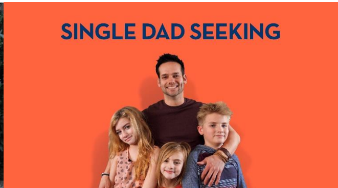
「シングルファザー婚活記」