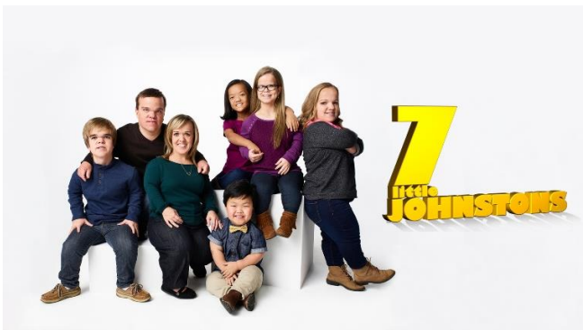
「7人の小さなジョンストン」