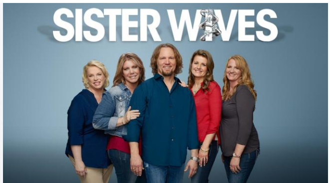
「ひとつ屋根の妻たち」