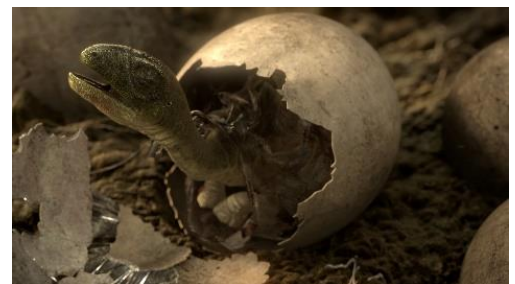
「BBC 超大作 プラネット・ダイナソー」