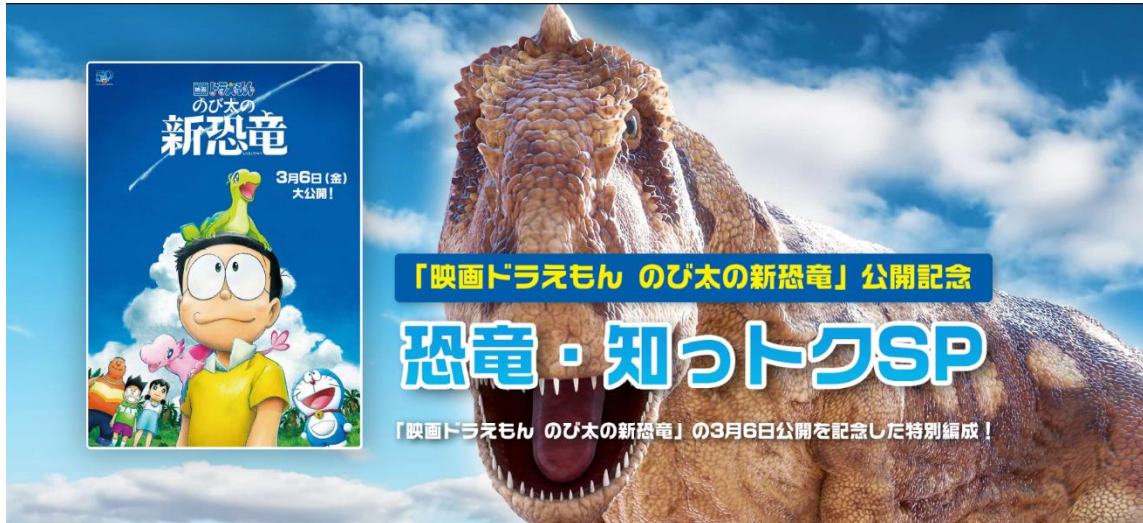
「恐竜・知っトクSP」特設ウェブサイト イメージ画像

ディスカバリー・ジャパン株式会社（東京都千代田区、代表取締役社長：デービット・マクドナルド）が展開する世界最大級の動物チャンネル「アニマルプラネット」では、ドラえもん50周年記念作品「映画ドラえもん のび太の新恐竜」の2020年3月6日（金）からの劇場公開を記念して、2月29日（土）より特別編成「恐竜・知っトクSP」を放送します。また、株式会社ジュピターテレコム（J:COM）と共同で制作したオリジナル番組「映画ドラえもん と恐竜の世界」を2月29日（土）よりJ:COMオンデマンド（※）で独占先行配信、アニマルプラネットでは3月1日（日）に放送を開始します。※視聴には「J:COM TV」へのご加入が必要です。さらに、2月15日（土）～3月31日（火）の期間中、抽選で50名様に「映画ドラえもん のび太の新恐竜」のぬいぐるみと恐竜柄の今治タオルセットが当たるキャンペーンも実施します。