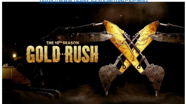
「ゴールド・ラッシュ～人生最後の一攫千金～」

https://www.dplay.jp/show/wheeler-dealers