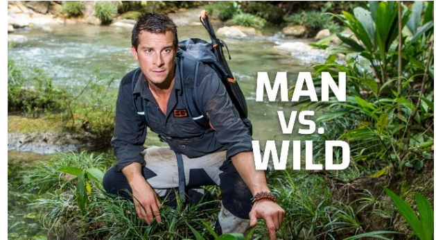
「サバイバルゲーム」

https://www.dplay.jp/show/marooned-with-ed-stafford