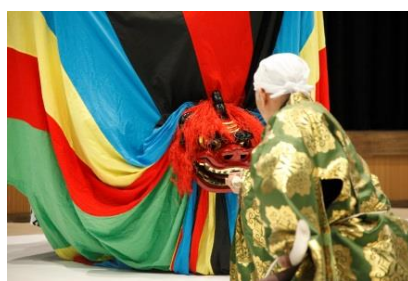
東京キャラバンin東北（2016年）