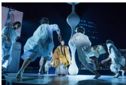
東京キャラバン～プロローグ～（2015年）

詳細は、公式Webサイト（ http://tokyocaravan.jp/ ）にてご覧いただけます。