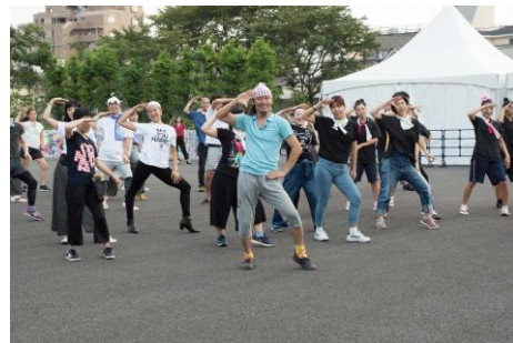
東京キャラバン in 八王子（2017年）

東京都及びアーツカウンシル東京（公益財団法人東京都歴史文化財団）は、「東京キャラバン in 熊本」を熊本県、熊本市、公益財団法人熊本県立劇場、熊本市現代美術館（公益財団法人熊本市美術文化振興財団）とともに開催します。「東京キャラバン」では、参加者も大切なアーティストと考えています。集結したアーティストと参加者が、一緒に新しいパフォーマンスが生まれる瞬間を体験することで、日本が文化の力でひとつになる大きなムーブメントとなり、東京2020オリンピック・パラリンピックと、その先の未来へと続いていくことを願っています。