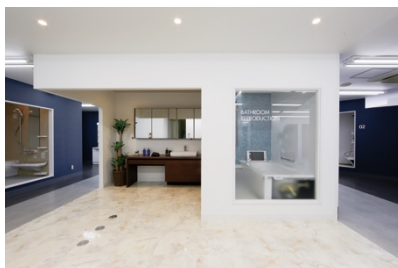
バスルーム/サニタリーフロア