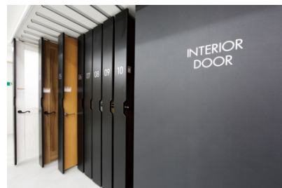
エクステリア/ インテリアフロア