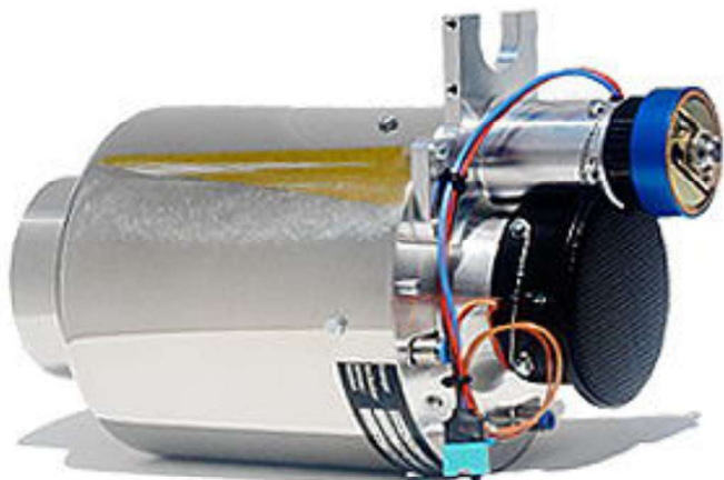
ターボシャフトエンジン