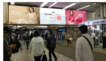
②小田急線 新宿駅 デジタルウォール