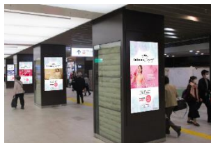
①西武線 池袋駅 スマイル・ステーションビジョン