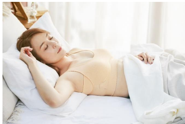
ジニエメルティタッチブラ