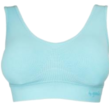
ジニエブラエアー 全6色6サイズ (S/M/L/LL/3L/4L)