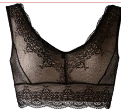
ジニエブラ 全12色6サイズ (S/M/L/LL/3L/4L)