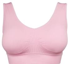
ジニエブラ 全6色6サイズ (S/M/L/LL/3L/4L)

※購入は、ジニエ特設WEBサイト通販でご購入（配送は後日） ※通常送料900円が送料無料