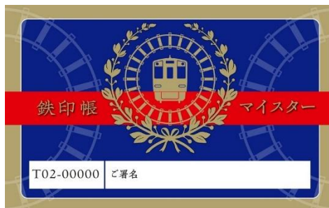
鉄印帳マイスターカード(見本)