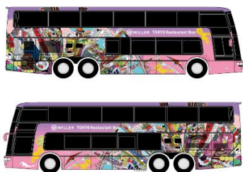
東京レストランバス外観

移動と食の融合により新たな感動体験を提供する「レストランバス」は、1 階にキッチン、2 階には対面式の座席とテーブルを備え、透明で開閉可能なオープンルーフは開放感があり、いつもと違う目線から眺める景色と、本格的な料理をお楽しみいただけます。東京レストランバスの外装は、東京らしさをイメージし、多数のビル群や観光名所を“食”と掛け合わせてポップなカラーリングでデザインしています。内装は、シックな色合いでまとめ、夜は調光可能な LED と間接照明により、高級感あふれる落ち着いた空間になっています。