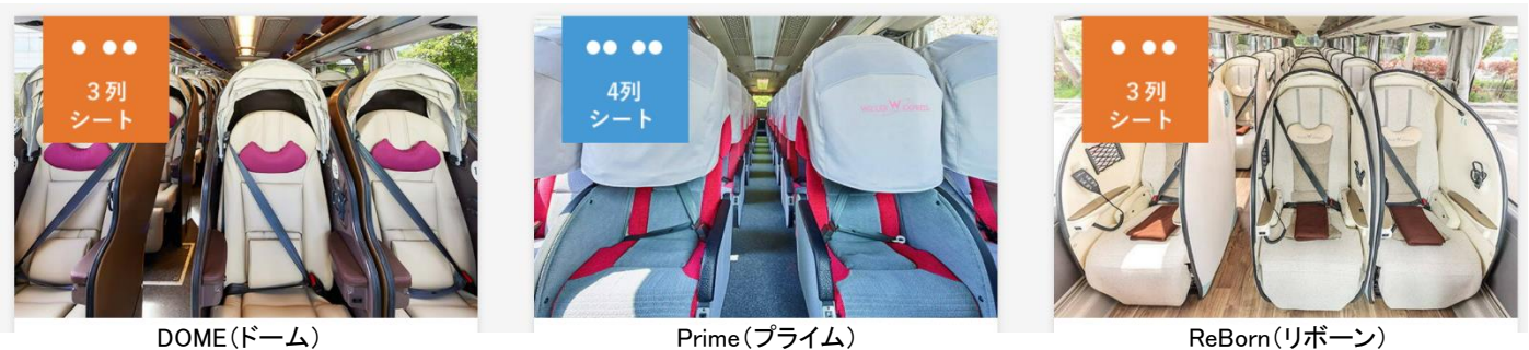
図 6 WILLER EXPRESS のオリジナルシートの例

また、24歳以上のお客様の増加は前々から感じていましたが、10%もの伸びは予想外でした。ウィラーエクスプレスは、複数のオリジナルシートを開発し快適性や女性の方も安心してご利用いただけるサービスを大切にしていますので、いままで夜行バスを敬遠していたお客様にそうした点で選んでいただいているのであれば、大変嬉しい限りです。