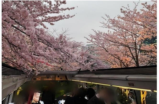
東京ミッドタウン付近

※★は桜の名所スポットです。桜の開花状況は天候によって前後する場合がございます。