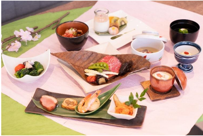
和食フルコースプラン