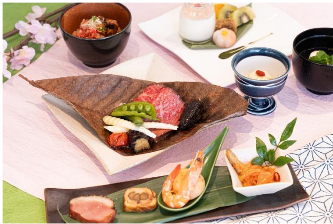
和食ディナープラン