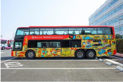
東京レストランバス外観

移動と食の融合により新たな感動体験を提供する「レストランバス」は、1階にキッチン、2階には対面式の座席とテーブルを備え、透明で開閉可能なオープンルーフは開放感があり、いつもと違う目線から眺める景色と、本格的な料理をお楽しみいただけます。レストランバス乗車中は、いつもとは違う高さ約3mの目線から眺める景色によって特別な時間を楽しむことができ、ガイドスタッフによる桜や観光名所の解説、豆知識の紹介もあり新しい発見に出会うことができます。※車両はプランによって異なります。