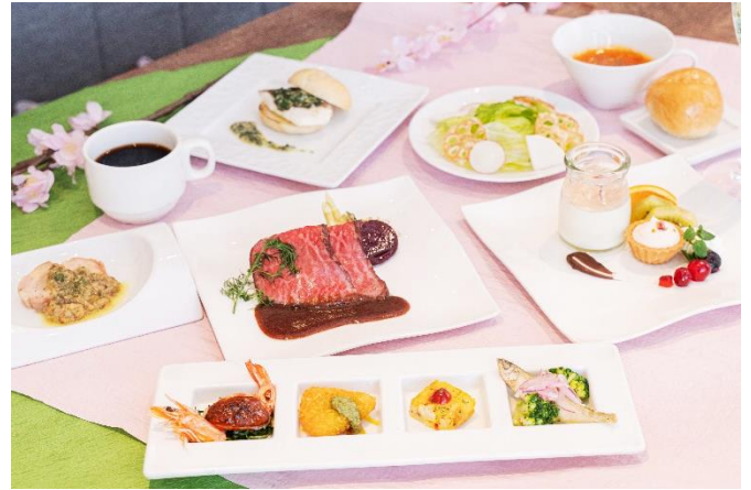
洋食フルコースプラン