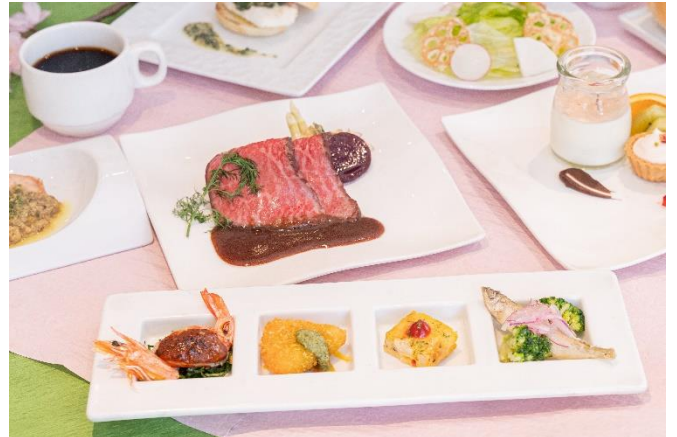
洋食ディナープラン