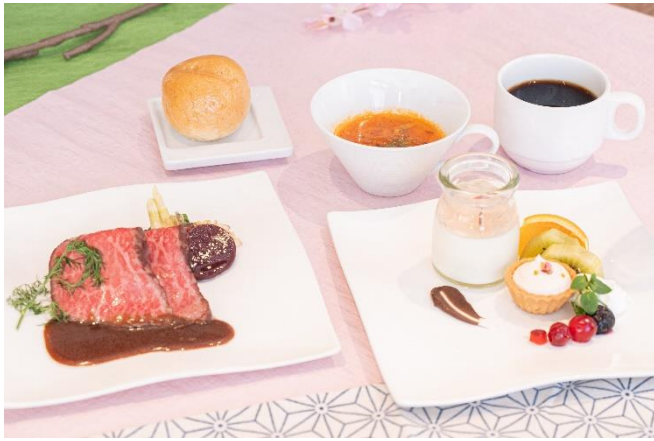
洋食ランチショートプラン