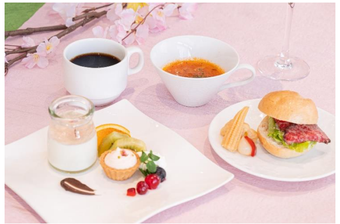
アフタヌーンティーショートプラン