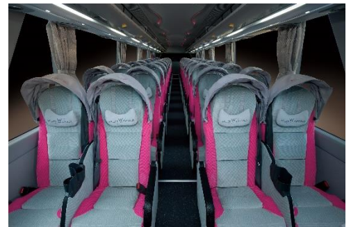
<リラックス>※シートイメージ