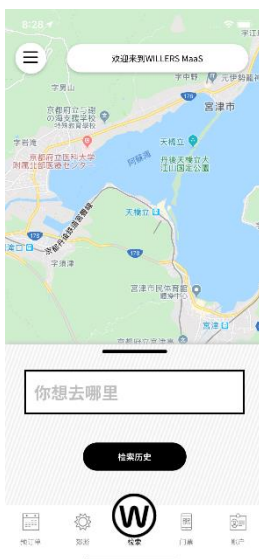
繁体字画面イメージ

③の多言語対応は、インバウンドのお客様にも使っていただきやすいよう、日本語だけでなく英語・中国語(繁体字)にも対応しました。