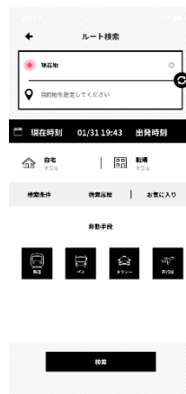
ルート検索/予約機能