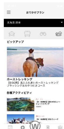
アクティビティ検索予約