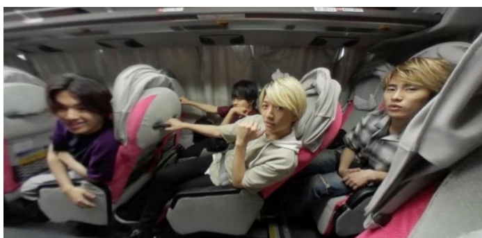
<VR コンテンツ イメージ>