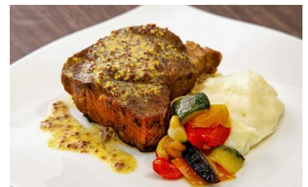
豚肩肉のコンフィ