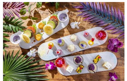
スペシャルアフタヌーンティー