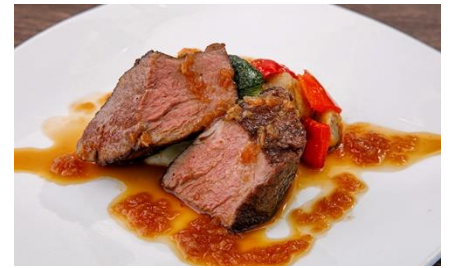
牛フィレ肉のローストシャリアピンソース