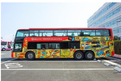
東京レストランバス外観

移動と食の融合により新たな感動体験を提供する「レストランバス」は、1階にキッチン、2階には対面式の座席とテーブルを備え、透明で開閉可能なオープンルーフは開放感があり、いつもと違う目線から眺める景色と、本格的な料理をお楽しみいただけます。東京レストランバスの外装は、東京らしさをイメージし、多数のビル群や観光名所を“食”と掛け合わせてポップなカラーリングでデザインしています。内装は、シックな色合いでまとめ、夜は調光可能なLEDと間接照明により、高級感あふれる落ち着いた空間になっています。