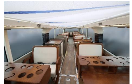
ロールスクリーン使用時の2階客席