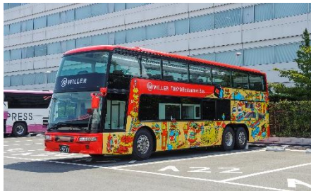
東京のあふれるような街並みを表現した外観デザイン