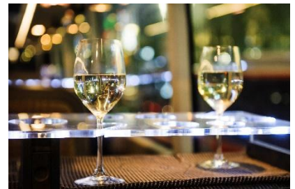
コップやボトル類はテーブルに固定可