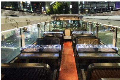
LED・間接照明点灯時の2階客席