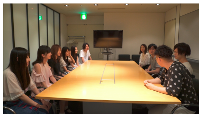
Episode01 未知との遭遇 ( https://youtu.be/3Uyuvqut9gA )

本プロジェクトの始動から制作過程を収録したドキュメンタリー映像を随時公開していきます。現在、プロジェクトのメンバーへの発表など、3話まで公開しています。