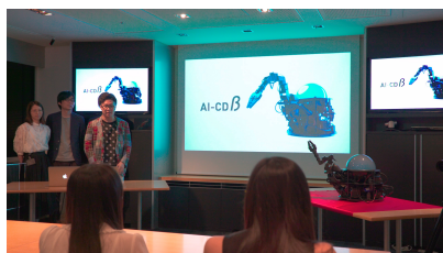
Episode02 「AI-CD β」の正体 ( https://youtu.be/DI4QhY3IJ0s )