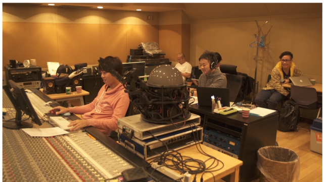
(ドキュメンタリービデオより、レコーディング風景)

先行公開された“楽曲の無い”ミュージックビデオを元に、複数の楽曲制作チームに依頼。結果4曲をクアトロA面シングルとしてリリースする。勿論それらは全て同じ映像のミュージックビデオとなる。