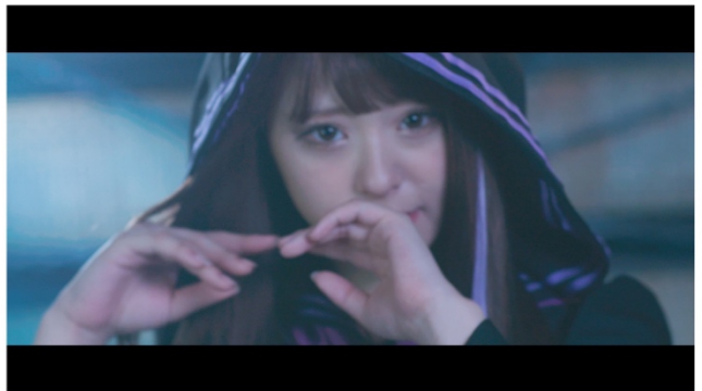
(ミュージックビデオより、ダンスとリップシンクシーン)

楽曲のBPM（楽曲のテンポ）を135に設定。アイドルのミュージックビデオでは欠かせないリップシンクの撮影では、楽曲が無いため過去の楽曲からBPMに近い曲を参考に歌っているニュアンスを残しながら、口元をやや隠すなど、試行錯誤し撮影。