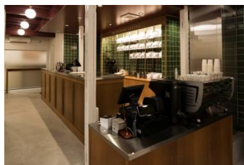
1F コーヒーショップ