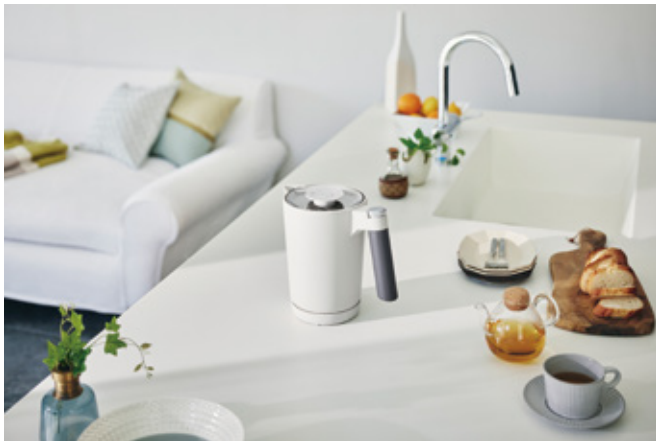
朝の忙しい時間はキッチンで利用。