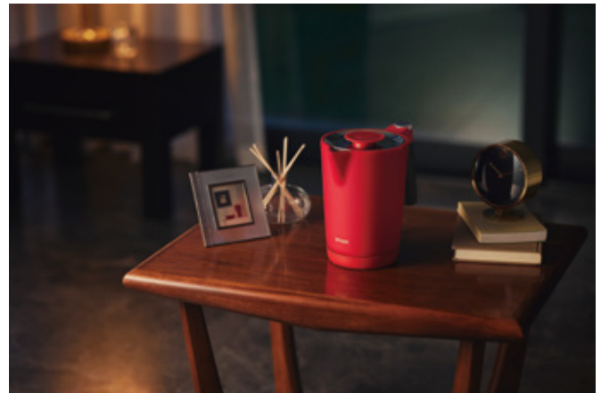
夜のほっとひと息タイムにも。