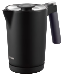
オニクスブラック&lt;KO&gt;