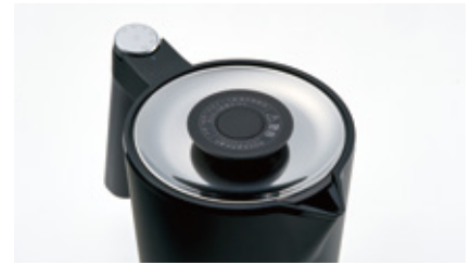
水面をイメージしたステンレスの天面

カラーは、「温かいお湯が入っている」ことを想起させるウォームカラーの3色を採用。インテリアに合わせてお選びいただけます。