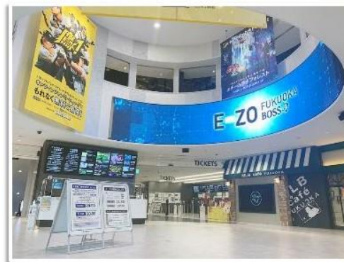
BOSS E・ZO FUKUOKAでの回収 2022年10月1日～2023年2月末まで

※再生ステンレス材を利用した製品はステンレス製ボトルに活用されるのみとは限りません。