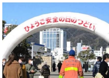
ひょうご安全の日推進県民会議事務局より提供