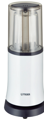
ミスティホワイト <WM>