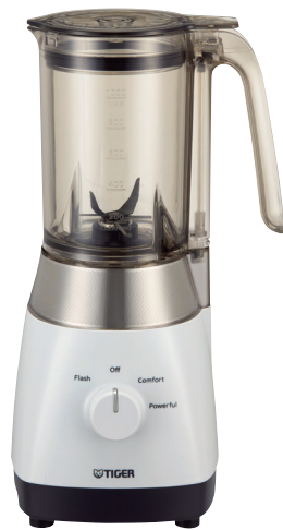
ミスティホワイト <WM>