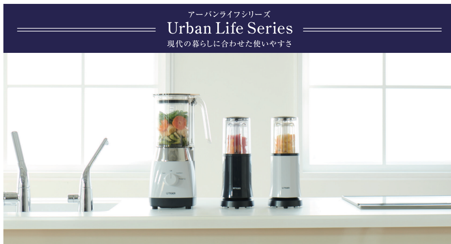
左からSKT-A100 ミスティホワイト、SKR-V250 ナイトネイビー・ミスティホワイト

* SONE値とは、騒音レベルを表すdB(デシベル)に対して実際に聞こえる音の大きさ(実感音)を表した単位。