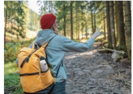
アクティブな休日に