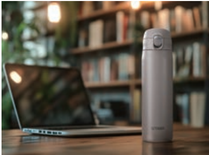
長時間、仕事に集中したいときに