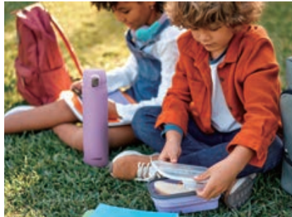
お子さまの通園・通学に