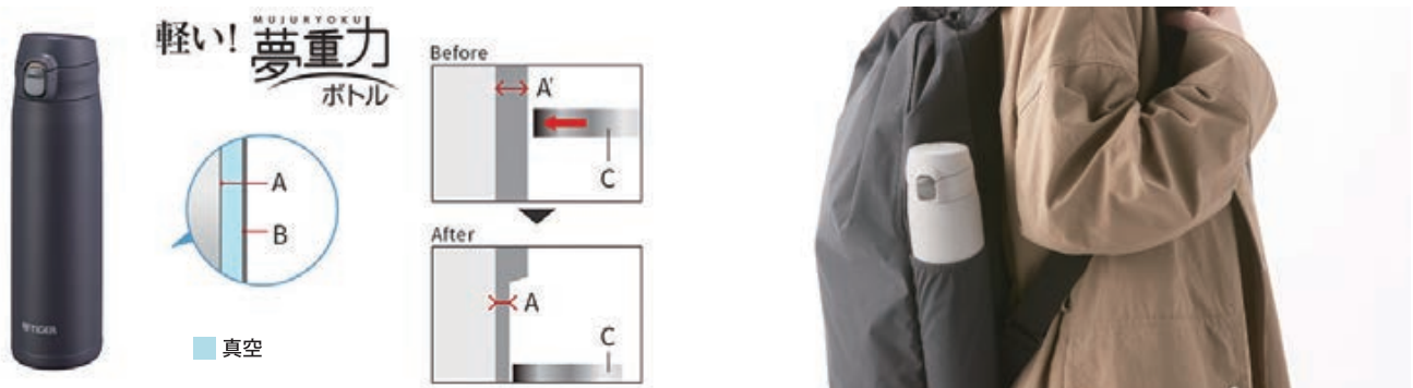
A':加工前の内筒の厚さ約0.3mm A:内筒の厚さ約0.08mm B:外筒の厚さ約0.5mm C:ローラーを押し当てる

当社独自のスピニング加工により、ボトルの内筒を薄く加工し、軽量化を実現。 さらに、リュック横のポケットやランドセルにも入りやすいサイズで、持ち運びに最適です。