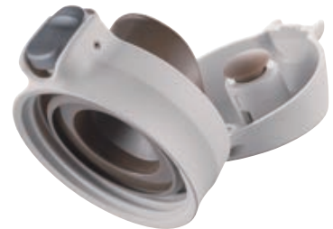
パッキン一体型せん 「らくらくキャップ」