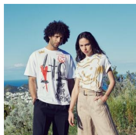
#1 グラフィティTシャツ (男女)