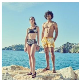
#2 スイムウェア (男女)