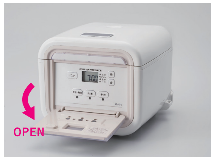
パネルカバーつきで炊飯ジャーらしくないデザイン 普段の操作(保温・取消/炊飯/予約)はパネルカバーを閉じたまま行えます。