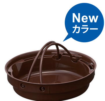
料理が映えるほっこりとした ブラウンカラーのクッキングプレート