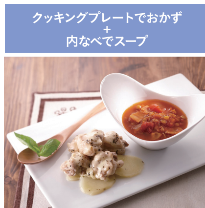
バジルチーズチキンと レンズ豆のミネストローネ