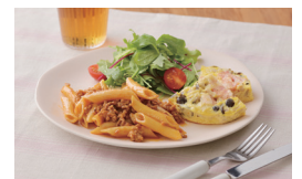
クッキングプレートでキッシュ、内なべでパスタを同時調理!