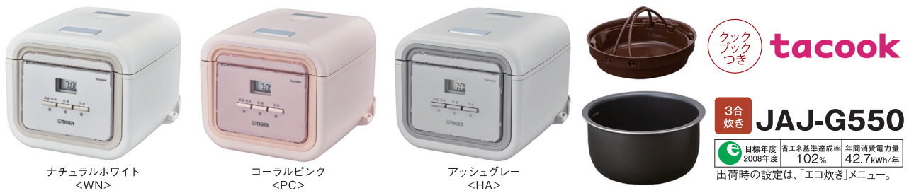
ナチュラルホワイト <WN>