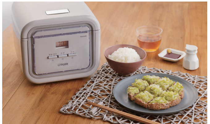
同時調理で作ったごはんとおかず