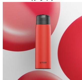
HUMAN ENERGY <RE> （レッド）