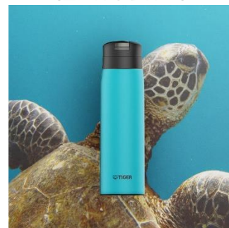
HONU <AC> （コバルトブルー）