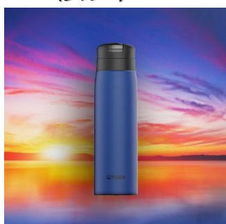
SUNSET <AE> （ブルー）