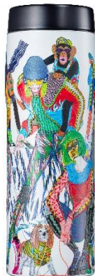
スーパーダイバー<WD>