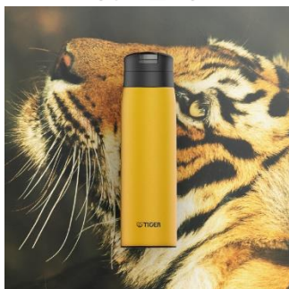
BENGAL TIGER <YE> （イエロー）