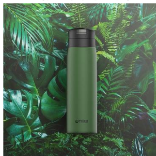
RAIN FOREST <GE> （ダークグリーン）