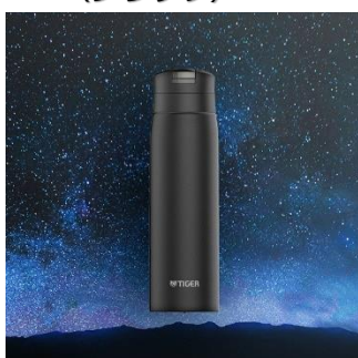
STARGAZE <KC> （ブラック）