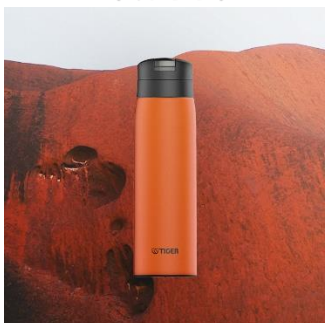
ULURU <TE> （オレンジ）