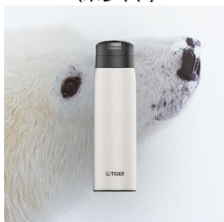
POLAR BEAR <WE> （ホワイト）