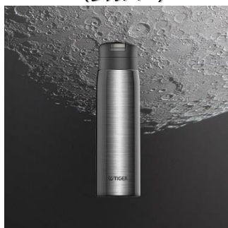
SILVER MOON <XE> （シルバー）