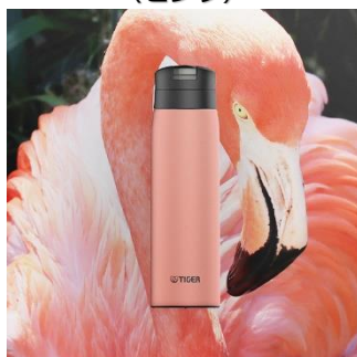
FLAMINGO <PE> （ピンク）