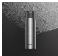
SILVER MOON<XE> (シルバー)