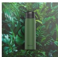
RAIN FOREST<GE> (ダークグリーン)