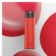
HUMAN ENERGY<RE> (レッド)