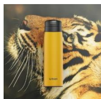
BENGAL TIGER<YE> (イエロー)