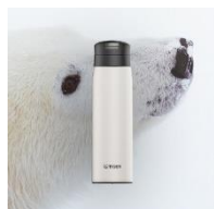
POLAR BEAR<WE> (ホワイト)