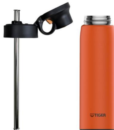
ストローせんは MXV-E050 (本体) につけて使用します。

衛生的に使用できるステンレスストローを飲み口に採用しました。発売中のタイガーカスタムボトル MXV-E050 (500mLタイプの本体) につけてご使用いただけます。(ストローせん使用時は保冷専用としてご使用ください。)