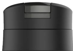
ワンプッシュ抗菌加工せん MXP-A002<KK>