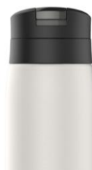
ワンプッシュせん スクリューせん