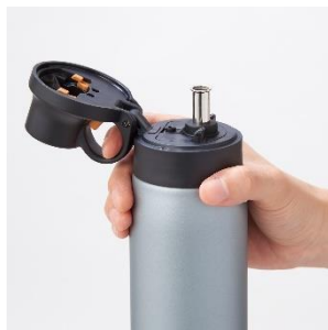
片手で開けやすい設計の「ループせん」※

※写真のボトル本体は、別品番「MCS-A050」です。 ※MXV型ではこちらのカラーはございません。