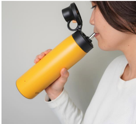
首を大きく傾けずに飲みやすい構造