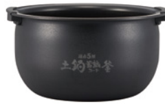
遠赤5層 土鍋蓄熱コート釜