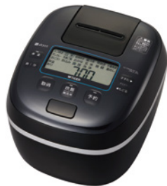
クラシックブラック<KC>