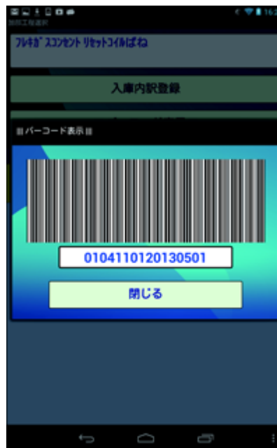
▲モバイルアプリ 製品番号・ロット番号のバーコード表示 現場のアイデアが反映された