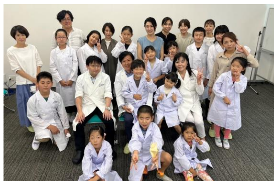
夏休み特別イベント 子どもたちの工場見学