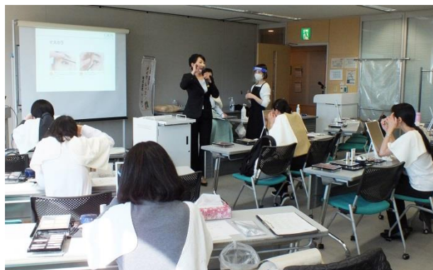
デモンストレーション