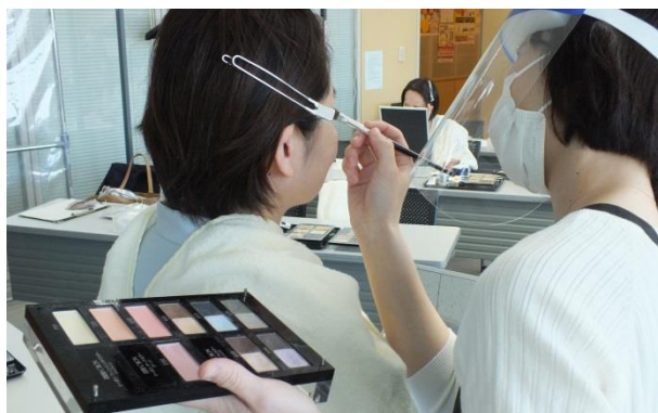
個別のメイクレッスン

株式会社シーボン(東証一部上場)は、“美を創造し、演出する”という企業理念のもと、誰もが自分らしく輝ける社会の実現を目指しています。