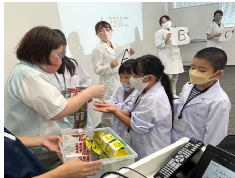
クイズに正解しお菓子のご褒美♡