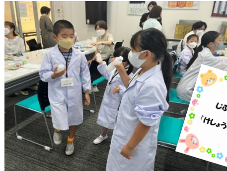
自分で作った化粧水を楽しそうに混ぜている子どもたち♪