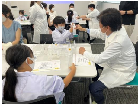
社長もイベントに参加し、子どもたちと交流しました

みんなで白衣を着て化粧水づくり。 好きな香り・エキスを組み合わせてオリジナルの化粧水を作成。