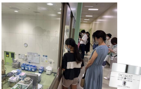
どのように化粧品が作られているか興味深々の子どもたち