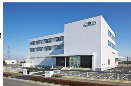
研究開発センター