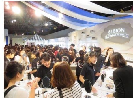
<写真は昨年の模様です>